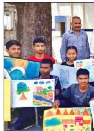
खटीमा के अटल उत्कृष्ट थारू राजकीय इं