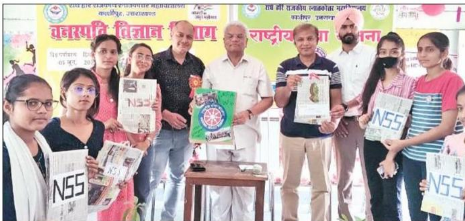
काशीपुर महाविद्यालय में स्वयंसेवियों के साथ अतिथि।